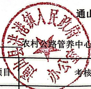
通山县农村公路管养中心目标考核评分明细表