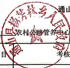
通山县农村公路管养中心目标考核评分明细表